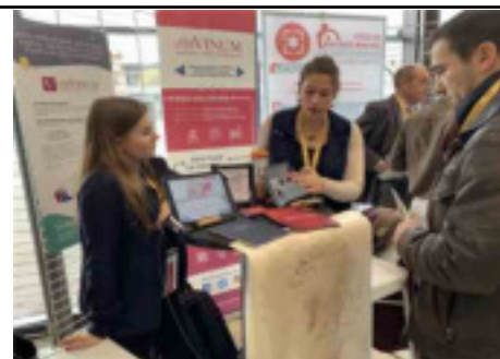
Vitavinum, start-up dijonnaise, était présente à l'événement.